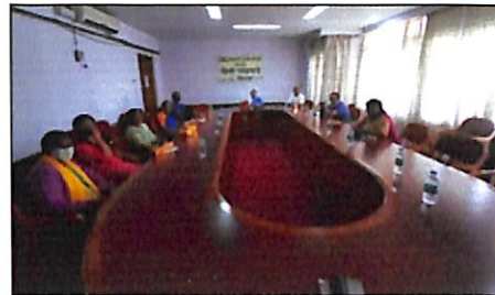
क्षे. स.प्र.सं., बेंगलुरु