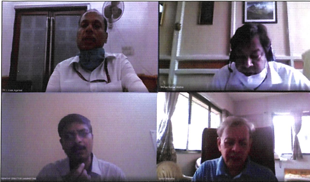
A view of the online meeting of the Executive Council of NCCT