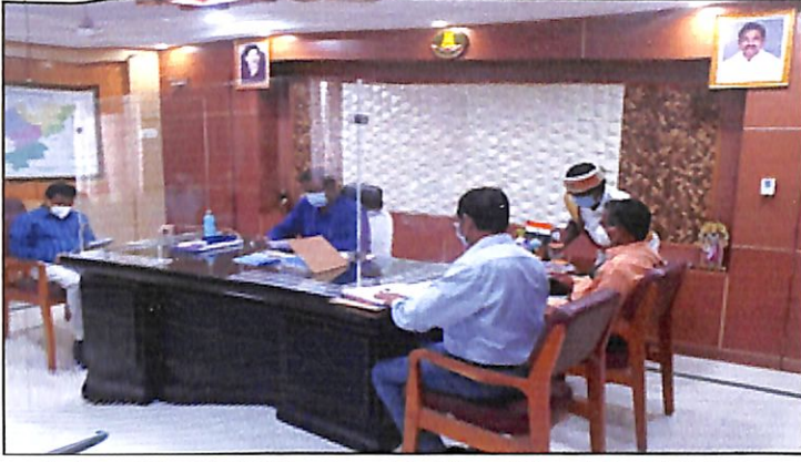
A view of the DLCC Meeting with Thiru. P.Ponniah, I.A.S District Collector, Kancheepuram District