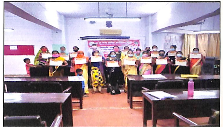
A view training programme for the women ICRP's of UP State Rural Livelihood Mission

ICM, Lucknow organised a three days classroom training programme for the women ICRP's of UP State Rural Livelihood Mission from 08-09-2020 to 10-09-2020. Altogether 30 participants participated in the programme.