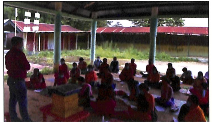
A view of the outstation programme on Beekeeping

ICM, Imphal conducted two days onsite training programme on Beekeeping for Farmers/SHG Members from 22-07-2020 to 23-07-2020 at Loitang Khunou, Imphal West. Altogether 34 Farmers/SHG Members participated in the training programme.