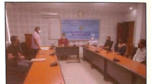
क्षे. स.प्र.सं., चण्डीगढ़