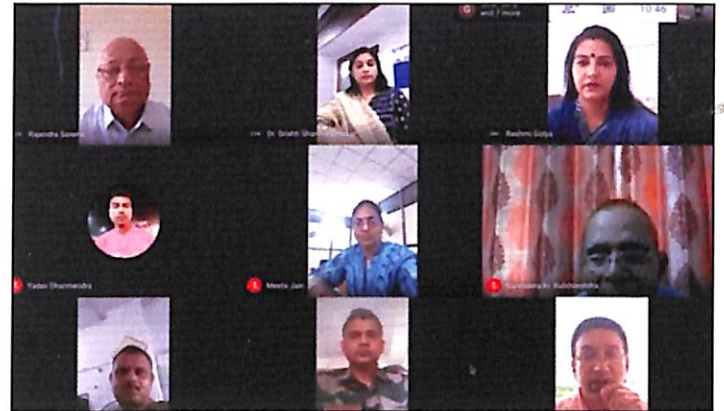
आनलाइन कार्यक्रम का एक दृश्य