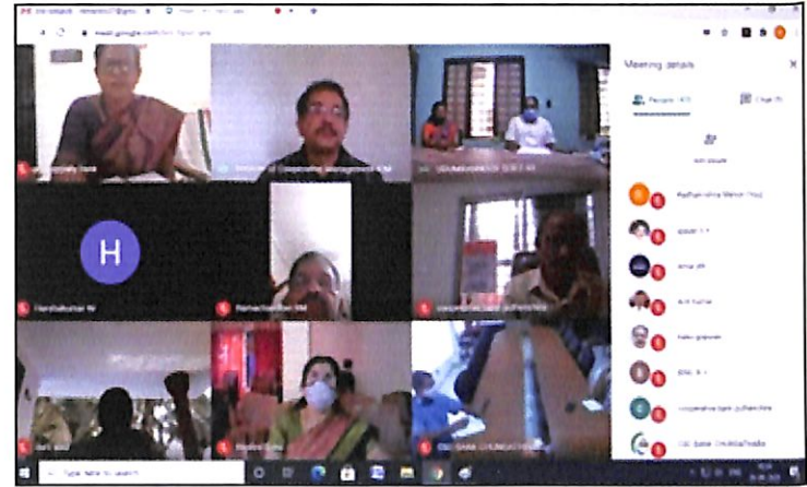
A view of the webinar organised on 29.9.2020