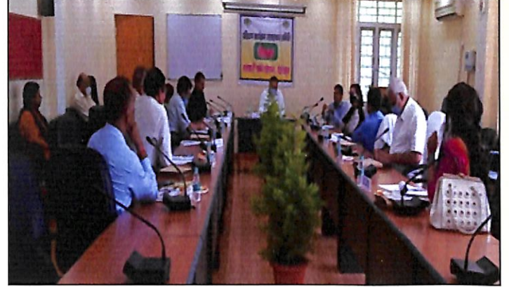
सलाहकार समिति की बैठक का एक दृश्य

कार्यक्रम करवाने की सहमति दी गई तथा सहकारिता विभाग के प्रशिक्षण कार्यक्रमों को करवाने हेतु विषयो पर चर्चा उपरान्त संस्थान को दैनिक बजट आदि बनाकर भेजने को कहा गया है। कोविड-19 के चलते प्रशिक्षण कार्यक्रमों को आन-स्पाट एवं वेबिनार से करवाने हेतु चर्चा की गई। अंत में बैठक में संस्थान द्वारा प्रस्तावित प्रशिक्षण कार्यक्रमों में उक्तानुसार परिवर्तन कर बैठक में प्रस्तावित कुछ नये कार्यक्रमों को जोड़ने तथा कुछ कार्यक्रम रद्द करते हुए संस्थान द्वारा प्रस्तावित प्रशिक्षण कलेंडर पर सहमति दी गई ।