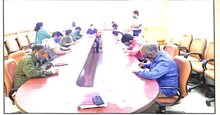
हिंदी पखवाड़ा कार्यक्रम के दौरान आयोजित हिंदी निबंध लेखन प्रतियोगिता का एक दृश्य