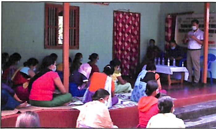
Resource person addressing the participating during Capacity Building for Formation of SHGs and Functioning of FPOs on 18 th September, 2020.

सहकारी प्रबंध संस्थान, जयपुर (ICM, JAIPUR) सहकारी विभाग के निरीक्षकों/मंत्रालयिक कर्मचारियों हेतु “Online Registration of Cooperative Societies” पर ऑनलाइन प्रशिक्षण कार्यक्रम