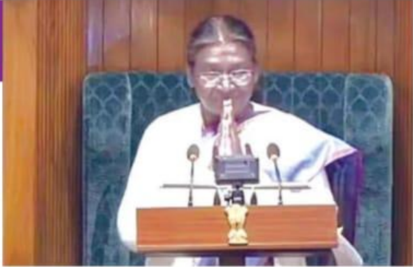
పార్లమెంట్ ఉభయ సభలకున్నోకీం ప్రసంగిస్తున్న రాష్ట్రపతి శ్రోపది ముచ్చు

సహకార భూమి ప్రతినిధి మ్యూజీటీ: ప్రభుత్వం వ్యవసాయ షరంగా సహకార సంఘాలను ప్రోత్సహిస్తోంది. అందుకే దేశంలోనే తొలిసారిగా సహకార మంత్రిత్వ శాఖను ఏర్పాటు చేశారు' అని రాష్ట్రపతి శ్రోపది ముచ్చు అన్నారు. అనవరి 31వ కొత్త పార్లమెంట్ భవనంలో ఐదైదో సమావేశాలను అమె ప్రారంభించారు. ఈ సందర్భంగా ఉభయ సభల సభ్యులను కలిగించి రాష్ట్రపతి తొలి ప్రసంగం చేశారు. గత పదేళ్లలో నరేంద్ర మోడీ నేతృత్వంలో చేపట్టిన ప్రభుత్వ విధానాలను వివరించారు. సహకార రంగంలో భారతదేశం ప్రపంచంలోనే అతిపెద్ద ధాన్య నిల్వదేశ గోదాములను నిర్మిస్తోందన్నారు. సహకార సంఘాలు కేవల గ్రామాల్లో 2లక్షల సాగైతీలు ఏర్పాటు చేస్తున్నామని అమె పేర్కొన్నారు. సాంఘిక అభివృద్ధిని అంశం రూపంలో వివరించారు.